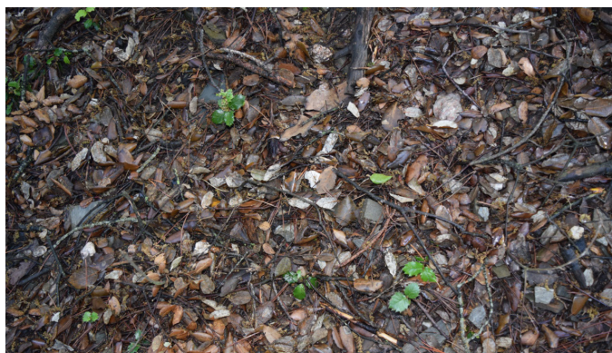
Figura 2. Suelo de bosque.

importante (Figura 2). Se trata de un material con un cierto grado de lignificación y con un contenido en nitrógeno bajo. La descomposición se produce en superficie, en las condiciones de humedad y temperatura del microclima interior del bosque. El proceso se realiza principalmente por hongos, que descomponen formando un humus forestal estable. Para que este proceso continúe, es necesario que se mantenga el aporte de hojas y las condiciones microclimáticas del interior del bosque. Esto se garantiza con una presencia continua de árboles. El objetivo de la gestión del bosque en un contexto regenerativo es que las condiciones de bosque se mantengan de manera continuada. El crecimiento, retorno e incorporación de los materiales orgánicos al suelo no debe interrumpirse en ningún momento. También existe un retorno en forma de ramas, sobre todo ligadas al aprovechamiento forestal. Estas ramas tienen una descomposición mucho más lenta que depende del grado de trituration en que se dejen. La madera de grandes dimensiones es el material aprovechado y no suele formar parte del retorno.