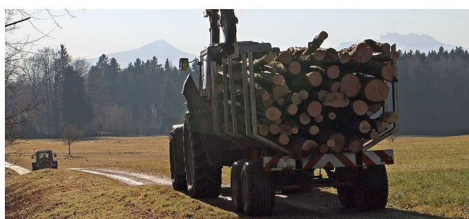
Figura 4. Camión con troncos saliendo del bosque.

La estructura también tiene un efecto importante en la forma en que los árboles aprovechan el agua disponible. En bosques jóvenes con densidades muy altas, la cubierta forestal puede ser tan cerrada que en el momento de la lluvia retenga una cantidad de agua muy importante que no llega al suelo. La disminución de la densidad de árboles y la presencia de árboles maduros y senescentes, con copas más claras, permite una mejor llegada de agua al suelo. Al mismo tiempo, la reducción de la densidad de árboles ayuda a disminuir la competencia entre ellos por el agua, que es el factor limitante. En la situación de cambio climático actual, esta modificación de las condiciones de estructura del bosque (reducción de la densidad de pies) es la manera más rápida para ayudar al bosque a adaptarse a unas condiciones de clima más secas que las que tenía cuando empezó a crecer.