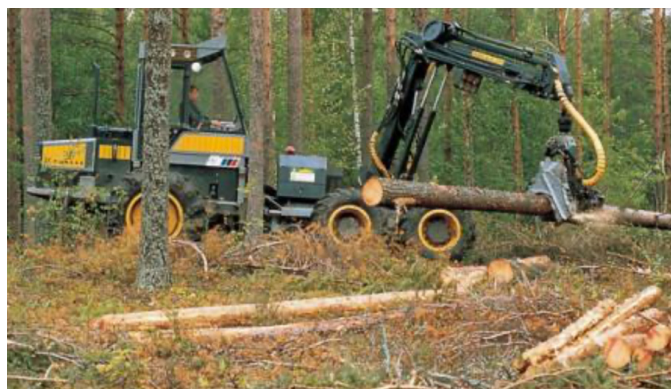
Figura 3. Maquinaria pesada para la extracción de troncos.

El aprovechamiento del bosque afecta de manera más o menos importante al ciclo del carbono del sistema a través de tres procesos diferentes: disminuyendo los stocks de carbono de la parte aérea (extracción de troncos, Figura 4 ), disminuyendo los stocks de carbono del suelo (aumento de los procesos de mineralización), y eliminando temporalmente una parte más o menos importante (o incluso todo) del retorno de hojas que alimenta el suelo. Estos procesos tienen un impacto temporal, pero si se alargan en el tiempo pueden generar una pérdida de producción del sistema. Un bosque con buena capacidad productiva tiene capacidad de compensar las extracciones (madera) y pérdidas (suelo) de carbono provocadas por los aprovechamientos. Es importante tener presentes en la gestión los elementos que pueden afectar a esta capacidad productiva: diversidad, producción continuada, condiciones microambientales del interior de bosque y factores que bloquean la red trófica del suelo. Debido a la escala de tiempo de la dinámica forestal, estos elementos de la gestión del bosque pueden pasar desapercibidos.