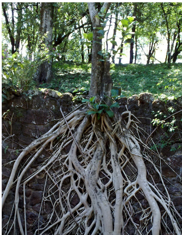
Figura 2. Las raíces juegan un papel fundamental en la alimentación de la red trófica del suelo.

nitrógeno. Además, las raíces pueden también absorber directamente aminoácidos y proteínas procedentes de los materiales orgánicos incorporados al suelo y parcialmente descompuestos por la actividad de la red trófica del suelo.