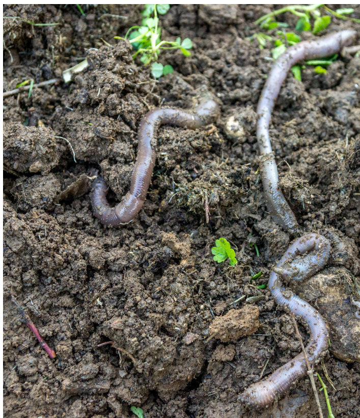
Figura 3. Las lombrices tienen un papel fundamental en la aireación del suelo.

El funcionamiento de los procesos biológicos del suelo requiere de condiciones de hábitat ( micro y macro poros ) que permitan el movimiento del aire en el suelo, el movimiento y retención del agua , y las condiciones necesarias para el movimiento y refugio de los diferentes componentes de la red trófica . El principal responsable de mantener estas condiciones de hábitat es la Materia Orgánica del Suelo (MOS) . Un componente importante de esta MOS es el humus , que es una fase más o menos estable del proceso de degradación del material orgánico incorporado al suelo por parte de la red trófica. Otro componente importante de la MOS son las colas orgánicas , que son producidas por los hongos y son las encargadas de crear los aglomerados estables de partículas minerales. La actividad de la macrofauna del suelo , como las lombrices o las hormigas, crea túneles que mejoran las condiciones necesarias para el funcionamiento de toda la red trófica ( Figura 3 ).